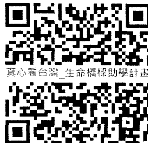
真心看台灣節目介紹生命橋樑計畫